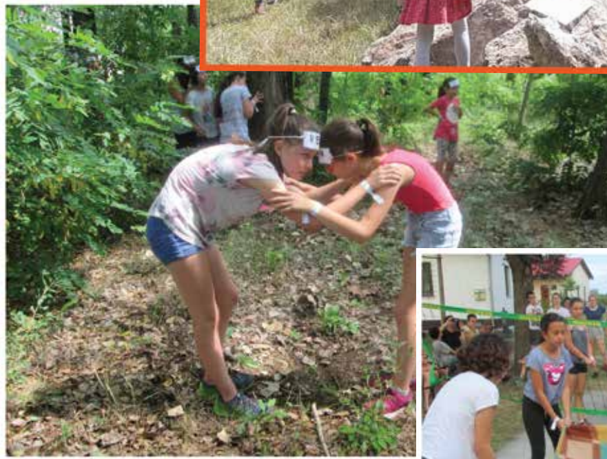
Soltvadkerti Zuglói Táborban a Hunyadi János diákjai