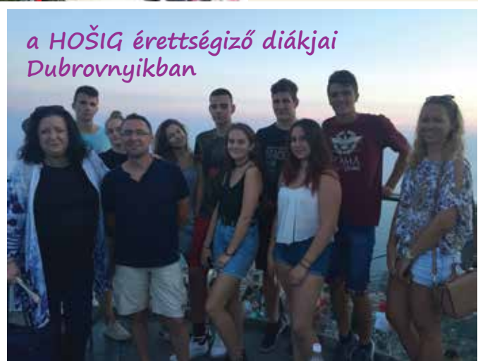
a HOŠIG érettségiző diákjai Dubrovnyikban