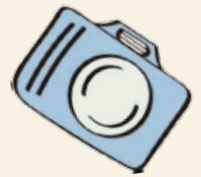
Csanádis gólyanap Agárdon.