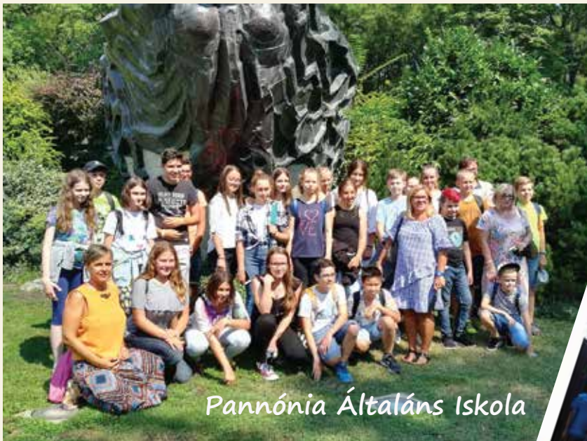
Pannónia Általános Iskola