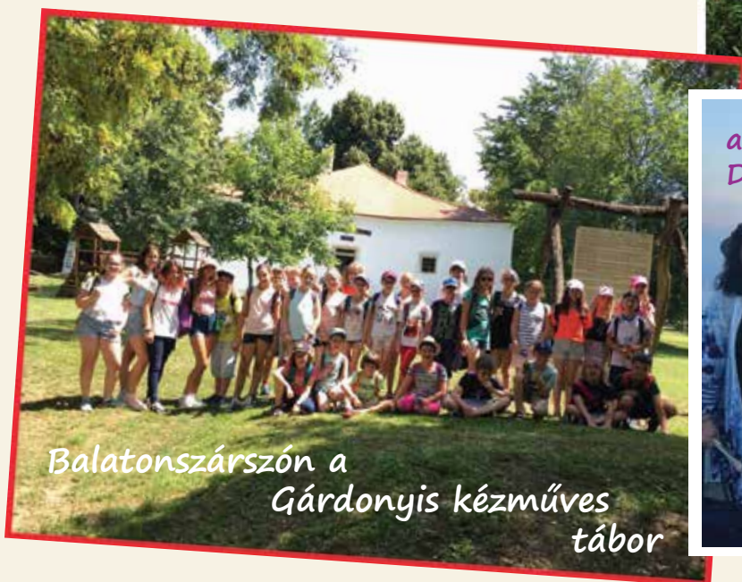
Balatonszárszón a Gárdonyis kézműves tábor